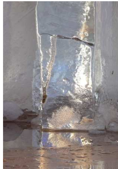
Glaces sous les Nefs, Nantes